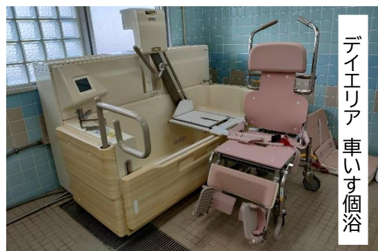
デイエリア 車いす個浴