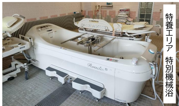
特養エリア 特別機械浴